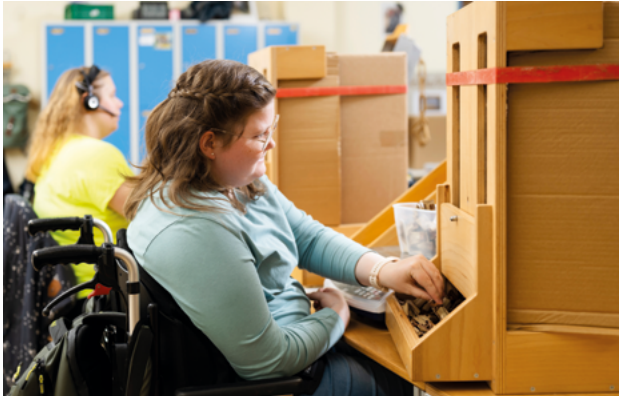
Sich als Teil eines Teams erleben

und der Boxdorfer Werkstatt. Ein großer Pluspunkt in Boxdorf: Aufgrund der Ausrichtung auf Menschen mit körperlichen Einschränkungen ist medizinisches Fachpersonal vor Ort, das Popp gut begleiten kann. Das Vorpraktikum bestätigte letztlich ihre Entscheidung: „Mir hat es in Boxdorf einfach sehr gefallen, von den Leuten her.“