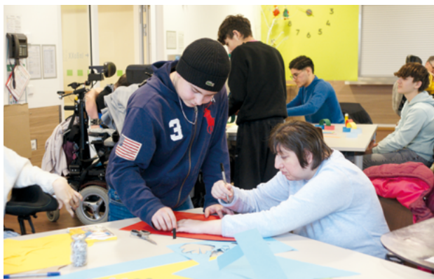
Berührungängste abbauen: beim gemeinsamen Basteln in der Förderstätte