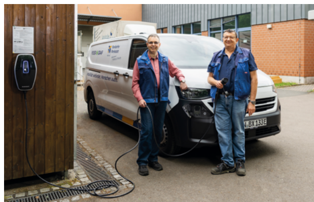
Neu und nachhaltig: Mit dem E-Transporter wird Büromaterial umweltschonender geliefert