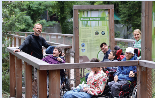
Miteinander beim Tiergartenausflug mit uniVersa

in Folge. Letztes Jahr überraschten sie Teilnehmende der Förderstätte mit persönlichen Geschenken.